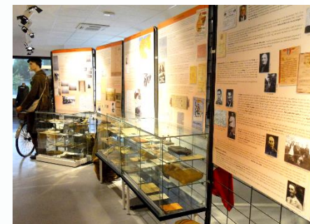
La vie quotidienne