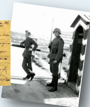
La ligne de démarcation, acteur majeur dans la Vienne sous l'Occupation