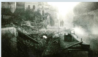
Derniers combats à La Roche Posay, 22 juin 1940

V.A.P.R.V.M. (Valorisation et Animation du Patrimoine Rural en Vienne et Moulière)