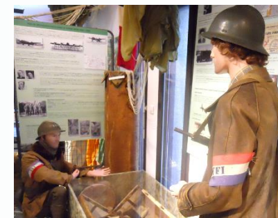
Les parachutages d'armes