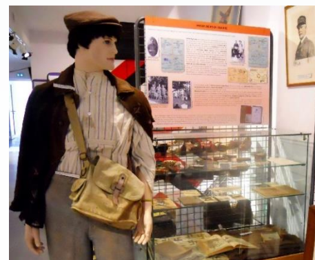
Les prisonniers de guerre

Une soixantaine de panneaux thématiques traitent de ces sujets, illustrés de photos et de témoignages, enrichis de collections sous vitrines, de scènes reconstituées. Plus de 300 pièces sont ainsi rassemblées : des armes, des masques à gaz, des uniformes mais aussi des objets de la vie quotidienne et des parachutes.