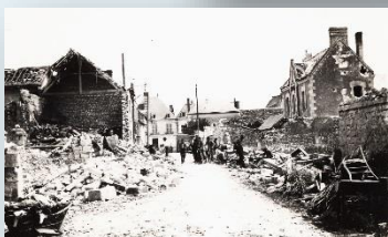
La guerre aérienne dans la Vienne