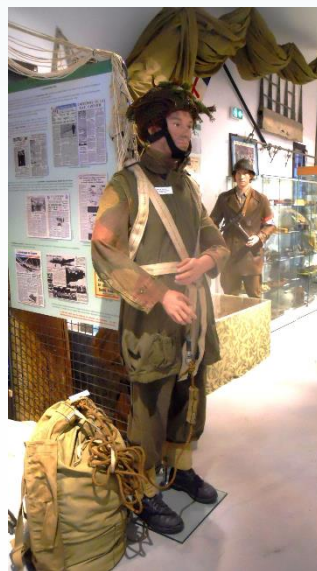
La résistance, les maquis, les SAS

Le musée aborde les thèmes de l'entrée en guerre, de la vie quotidienne sous l'Occupation, des camps d'internements, du STO, des chantiers de jeunesse, de la Résistance et des maquis, de la déportation, de la guerre aérienne, des bombardements, de la Libération.