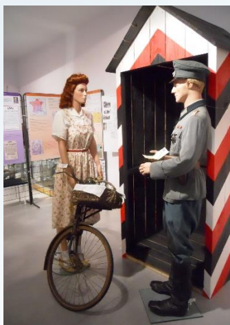
Le passage de la ligne de démarcation